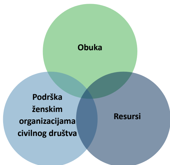
Slika 1. Glavne preporuke za provedbu TIC-a u Hrvatskoj

Istraživanje je također pokazalo da rodno uvjetovano nasilje nad ženama rezultira ozbiljnim psihološkim posljedicama, uključujući PTSP i mnoge simptome traume. Djelatnici u sudstvu, zdravstvu i socijalnoj skrbi su svjesni učinaka traume, no ta tema nije dio njihove obuke, a provedba politika je neučinkovita. Skrb temeljena na znanju o traumi uzima u obzir fizičke i mentalne posljedice traume, a osobama koje su proživjele traumu nudi priliku da ponovo izgrade odnose i povjerenje koje su zlostavljanje i izdaja skršili. Osobi koja je proživjela traumu potrebno je dati vrijeme i prostor da bi donijela svoje vlastite odluke, inače programi podrške žrtvama riskiraju ponovnu traumatizaciju žrtve umjetno nametnutim uvjetima za primanje usluga. Stoga su istraživanja i rad na poboljšanju podrške usredotočene na žrtvu koja se temelji na skrbi temeljenoj na znanju o traumi od krajnje važnosti za pružanje dugoročne i dobrotvorne podrške i osnaživanja žena koje su proživjele rodno uvjetovano nasilje.