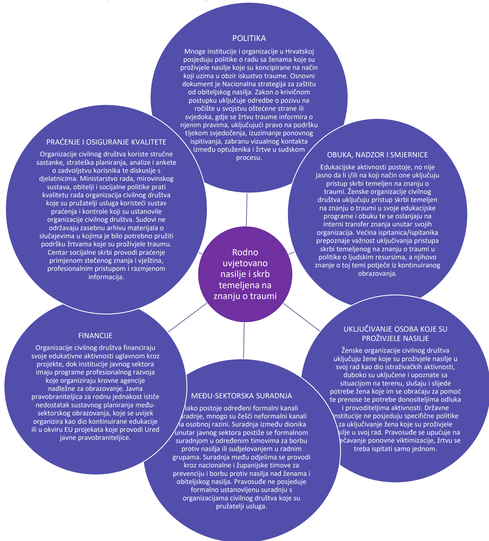
Slika 3. Analiza polu-strukturiranih intervjua